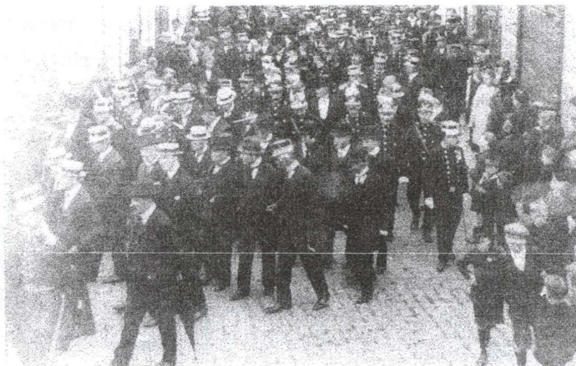
Begravenisstoet (komende vanuit de Kerkstraat) van de vermoorde politiecommissaris Gentil Demeyer (17 juli 1920). Vele prominenten waren er aanwezig. (Uit de brochure : " 't Is Melle", samengesteld door Marc Aelterman en uitgegeven in 1978 door de v.z.w. Koninklijke Vereniging Sport & Nering Melle).

Meer dan twee jaar later, namelijk op vraag van de weduwe Demeyer, kwam het punt van de gedenksteen op het graf van de vermoorde politiecommissaris nog eens op de agenda van de gemeenteraad. Het ontwerp van de Melse beeldhouwer Jules Vits (1868-1935) en het bijhorende prijskaartje werden nogmaals besproken. De praktische realisatie werd uiteindelijk nog wat uitgesteld omdat op dat moment de nodige geldelijke middelen ontbraken. Op 20 augustus 1924 gelastte het schepencollege Jules Vits met de uitvoering van zijn ontwerp. Tenslotte werd op het college van burgemeester en schepenen van 01 oktober 1924 besloten de volgende tekst te