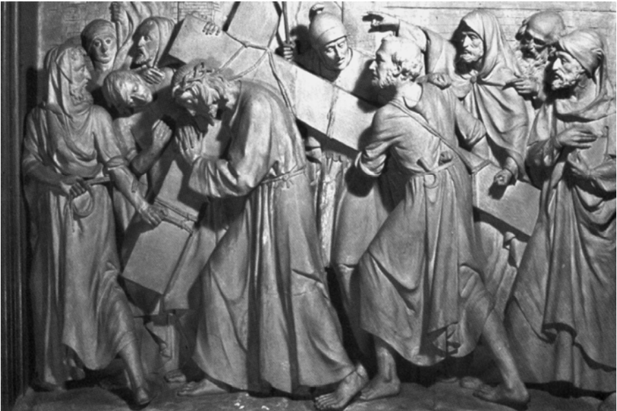
Vde statie : "Jezus ontmoet Simon van Syrene"