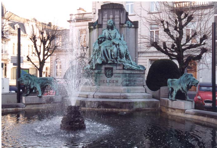
MONUMENT 2 DE LINIE REGIMENT TE GENT