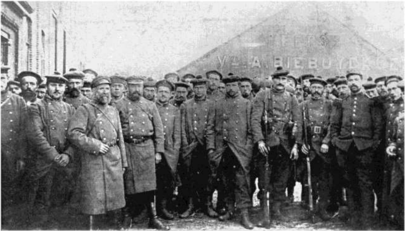
Foto van een aantal Franse vlootfuseliers die begin oktober te Melle vochten tegen de Duitse invaller.

Op 24 juni 1934 had onder massale belangstelling de onthulling plaats van het indrukwekkend monument, een compositie van architect W. Van Hove en beeldhouwer J. Bernaert.