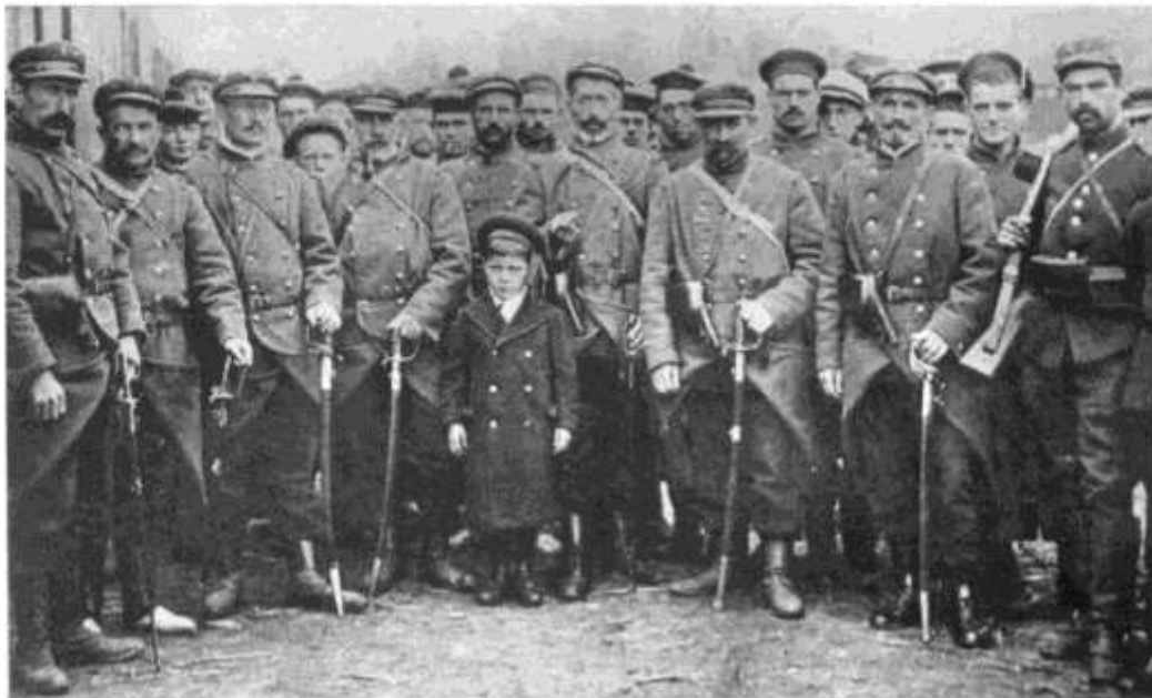
Quelques Fusiliers-Marins qui combattirent à MELLE en 1914. — Reprod. interd. Groep Marine-Soldaten welke in 1914 te Melle gevochten hebben. — Verbod. nade.