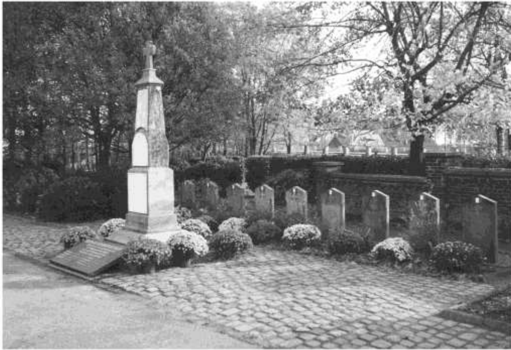
Kerkhof Melle : de grafzerken van de in oktober '14 te Melle gesneuvelde Franse vlootfuseliers.

Het zijn die gegevens die later op de grafstenen en het monument op het kerkhof werden aangebracht nl. :