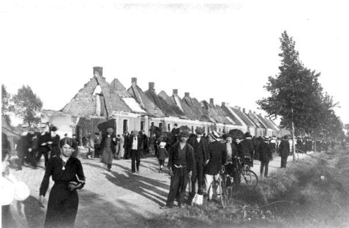
De zogenaamde "Twaalf Huizen" aan de huidige Collegebaan, in brand gestoken door Duitse troepen op 07.09.1914.

Woedend om de felle tegenstand die zij te Melle ondervonden, vernielden de Duitsers de inboedel van verschillende woningen en werden een dertigtal huizen platgebrand tussen het college en Kwatrecht. (In een volgende uitgave van ons tijdschrift daarover meer).