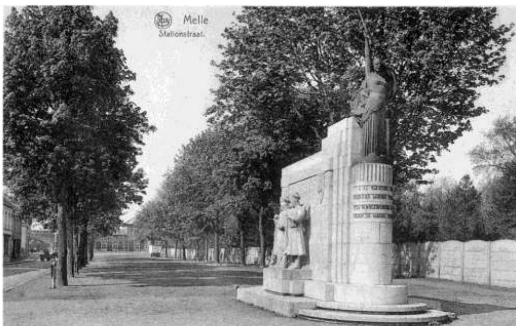
Monument ter ere van de gesneuvelde Franse vlootfuseliers te Melle

Op zaterdag 23 juni 1934, de dag voor de inhuldiging, was in het St.-Pietersstation te Gent omstreeks 16 uur een trein toegekomen waaruit een detachement vlootfuseliers stapte en nog 15 oud-strijders die in oktober 1914 aan de slag van Melle hadden deelgenomen.