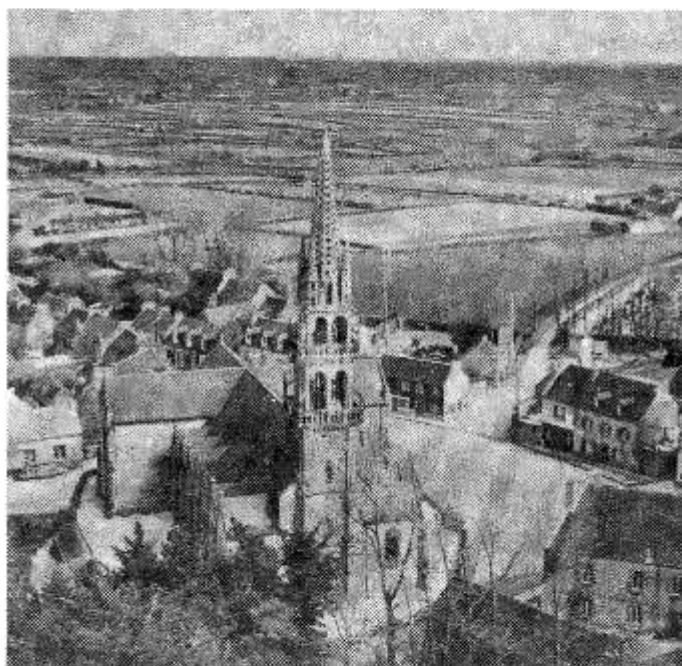
2) Plounévez-Lochrist : zicht op de kerk.

Wanneer we later te weten kwamen dat die gemeente in 1914 slechts 4.052 inwoners telde, beseften wij maar al te goed welke zware tol die verschrikkelijke oorlog geëist had van de mensen uit dat Bretoense dorp.